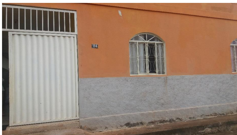
Figura 1. Registro fotográfico da visita.

No dia 08/06/2017, equipe técnica da empresa Synergia, enviou SMS para os números declarados pelo manifestante, com o objetivo que a família entre em contato com a empresa para realização do Cadastro Integrado.